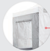
WAND MET INGANG