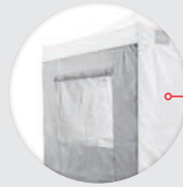
WAND MET VENSTER